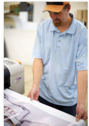
Erschwingliche Skalierbarkeit für wachsende Betriebe